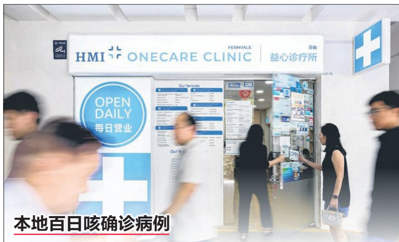
本地百日咳确诊病例